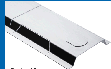
Breite 10 cm

Der Revi-Stichkanal ermöglicht einen direkten und sehr einfachen Anschluss der Fassadenrinne an den jeweiligen Ablauf.