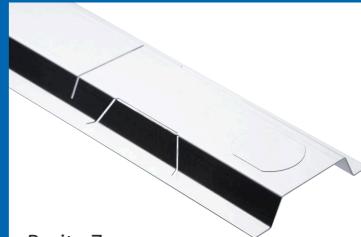
Breite 7 cm