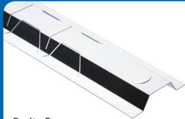
Breite 5 cm